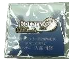
次年度地区ピンバッチ