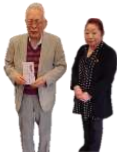
募金贈呈 G 補佐より NPO 法人希望理事長へ